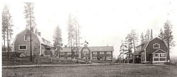
Floda Arbetarkoloni omkr 1910