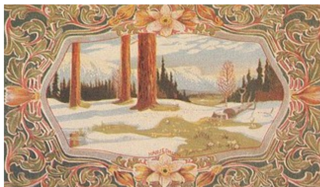
Härjedalsvykortet med mosippan